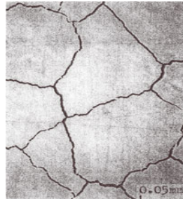
写真-2 表面の亀甲状亀裂