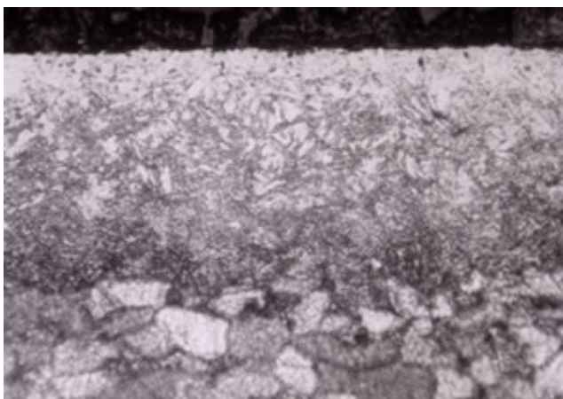
(SPCC材に処理) 写真-1 N-クエンチの断面